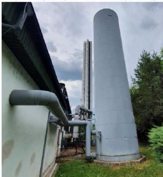
Obr. 12 - Nevyužívaná akumulční nádrž u kotelny Šipší

V teplárně Šipší je instalována tlaková akumulční nádrž s objemem 100 m 3 . Při prohlídce však bylo zjištěno, že akumulční nádrž není využívána. Pro provoz soustavy CZT by bylo rozhodně vhodné využívat akumulátor tepla. Důrazným důvodem pro využití akumulátoru tepla je možnost používat kogenerační jednotky i v době, kdy není dostatečný odběr tepla. Tento jev může výrazně optimalizovat ekonomiku provozu kogeneračních jednotek.